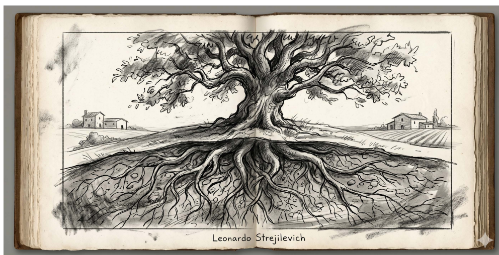
Figura 2: Ilustración: Las raíces que nos unen a lo que pensamos y comemos.

Adoro esta región que elegí libremente para vivir, y me gusta vivir aquí porque he echado raíces aquí, raíces profundas y delicadas que me unen a esta tierra donde no nacieron y murieron mis abuelos y mis padres, esas raíces que me unen a lo que se piensa y a lo que se come, a las costumbres como a los alimentos, a los modismos regionales, a la forma de hablar de sus habitantes, a los perfumes de la tierra, de las aldeas y del aire mismo.